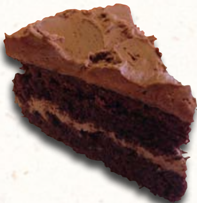
ČOKOLÁDOVÝ DORT – máslo, čokoláda 86%

Při jejich výrobě používáme poctivé suroviny – máslo, kvalitní hořká čokoláda s vysokým obsahem kaka, čerstvé mléko a smetana, mouka, kvásek. Produkty naší cukrárny jsou vždy lahodné a chutné a připravené z kvalitních a čerstvých surovin.