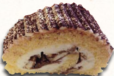
MARCIPÁNOVÁ ROLÁDA – máslo, sezónní ovoce, marcipán