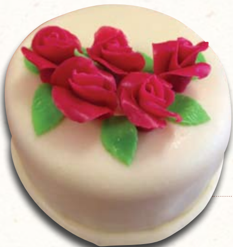
DORT S RŮŽEMI