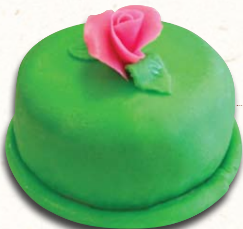
DORT PRINCEZNA - máslový krém, šlehačka, malinový džem, marcipán.